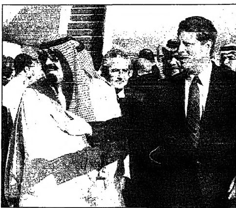
الملك عبد الله الثاني يلتقي السفير الامريكى كينيث كليرتوت في عمان

برامج العراق لاسلحة، وتضمن زيارة الامير عبد الله... الامير عبد الله يلتقي كليتوت وانفجار الخبر يتصدر المباحثات